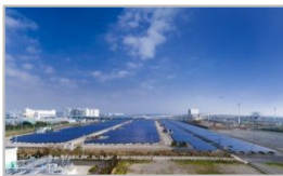
▲ 展望スペース / 構内

決められた時間に開催されるガイドツアーだよ! 開催時間や見学箇所はホームページで確認してね!